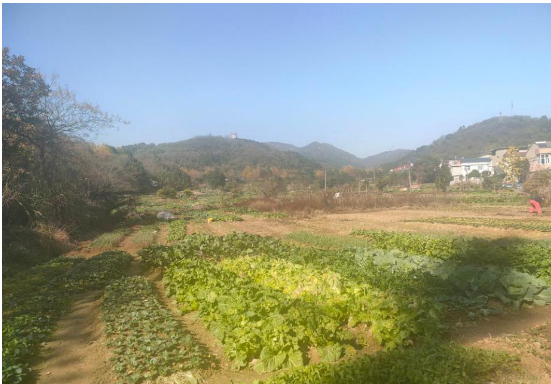
图2 港口现状（郭家湾支港 0+300-0+500 大面积菜地）