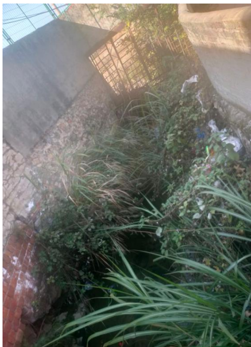
图 5 港道现状（岸坡杂草丛生）