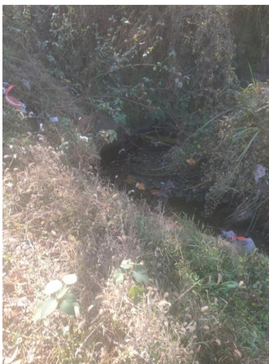
图3 港口现状（生活垃圾） 郭家湾支港 0+400-0+500