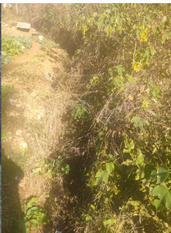
图4 港口现状（淤积） 郭家湾支港 0+100-0+700