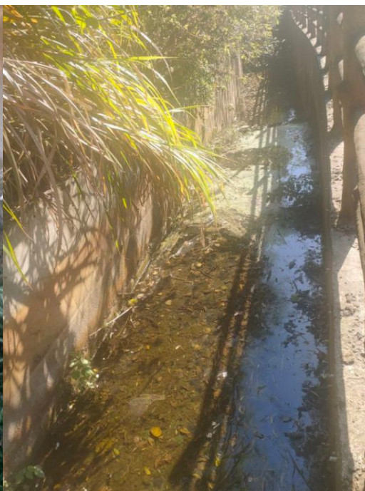
图 6 港道现状（U 型渠）