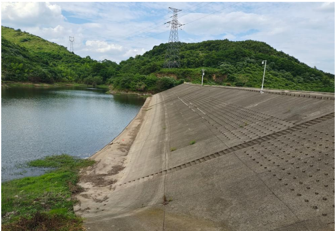
图 3 水库迎水面坝坡现状