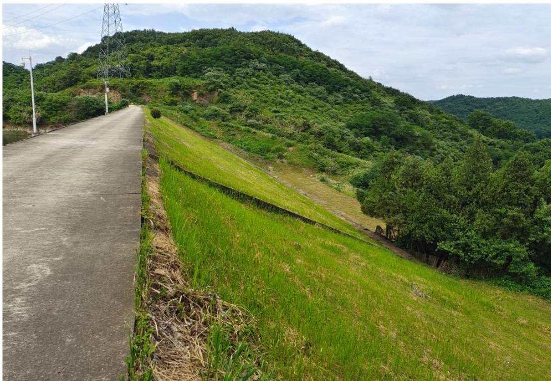
图 4 水库背水面坝坡现状