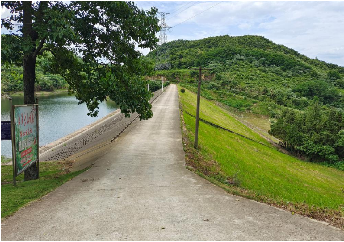
图 2 水库坝顶现状