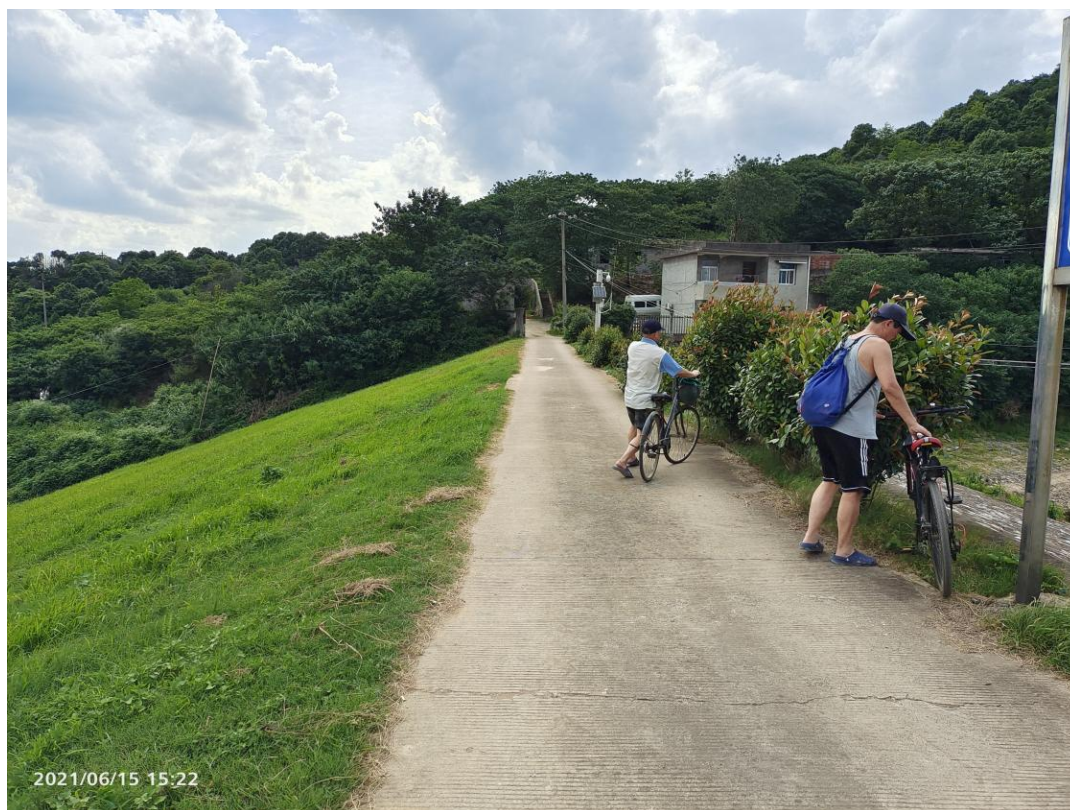
图 2 水库坝顶现状