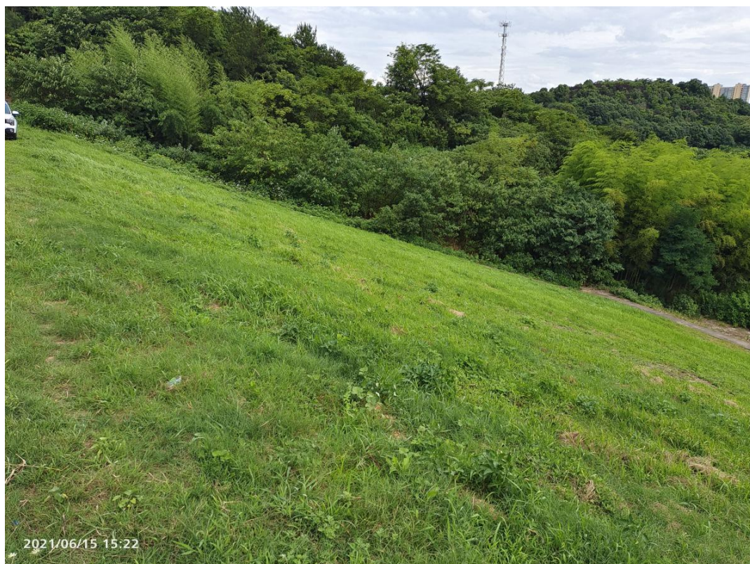
图 4 水库背水面坝坡现状