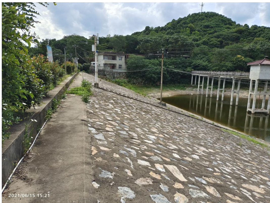
图 3 水库迎水面坝坡现状